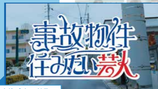
オリジナルドラマ